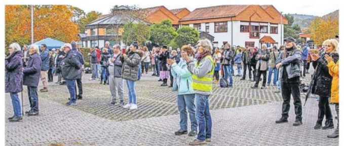
Zahlreiche Bürger beteiligten sich an der Gemeinschaftsveranstaltung in Lieblos.

Main-Kinzig-Kreis (re). Für den vergangenen Samstag hatten die Initiativen „Allianz pro Grundgesetz“ und „Querdenken-6051“ erstmals nach Lieblos eingeladen. Unter dem Motto „3-G – G-lück G-ehet nur G-einsam“ hieß es, gemeinsam „Nein“ zu sagen zu Spaltung, gesellschaftlicher Ausgrenzung und Diskriminierung von Menschen und „Ja“ zu sagen zu Gemeinschaft, Grundrechten und einem offenen Debattenraum.